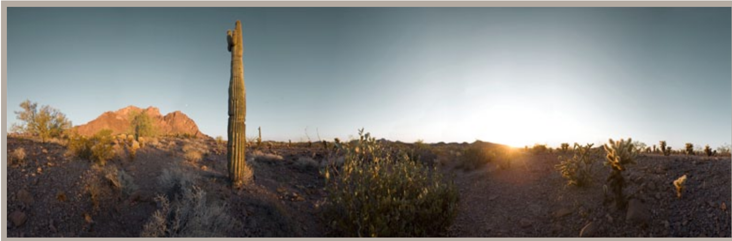
"El monje", Pablo Pro 2008

“Mi necesidad de explorar persevera, paulatinamente logro dotarme de una escafandra y sumergirme en el entorno, hasta llegar a prescindir de la bombona de oxígeno y hallar el todo presente en la aparente nada. Poco a poco la inmersión se va haciendo cada vez más natural, hasta sentirme en mi propio medio. Me voy despojando de patrones, dudas y miedos hasta ser consciente de que ésta debe ser mi rutina diaria: en este mundo de resultados, el PROCESO pasa a ser lo relevante.”