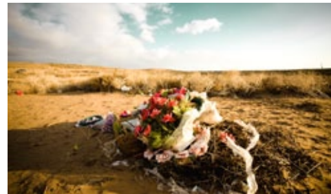
“La muerte”, Pablo Pro 2008

“Tengo el ambicioso sueño de retratar mis vivencias a través de la luz y el encuadre. Persigo lo sutil, lo efímero, todo aquello que se revela ante la mirada que atraviesa”