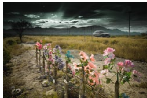
“El amor”, Pablo Pro 2008